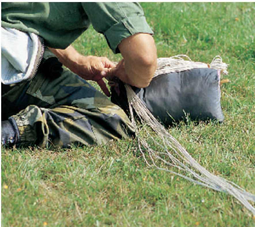
Fallskärmsjägarnas förmågor är efterfrågade, inte minst internationellt.