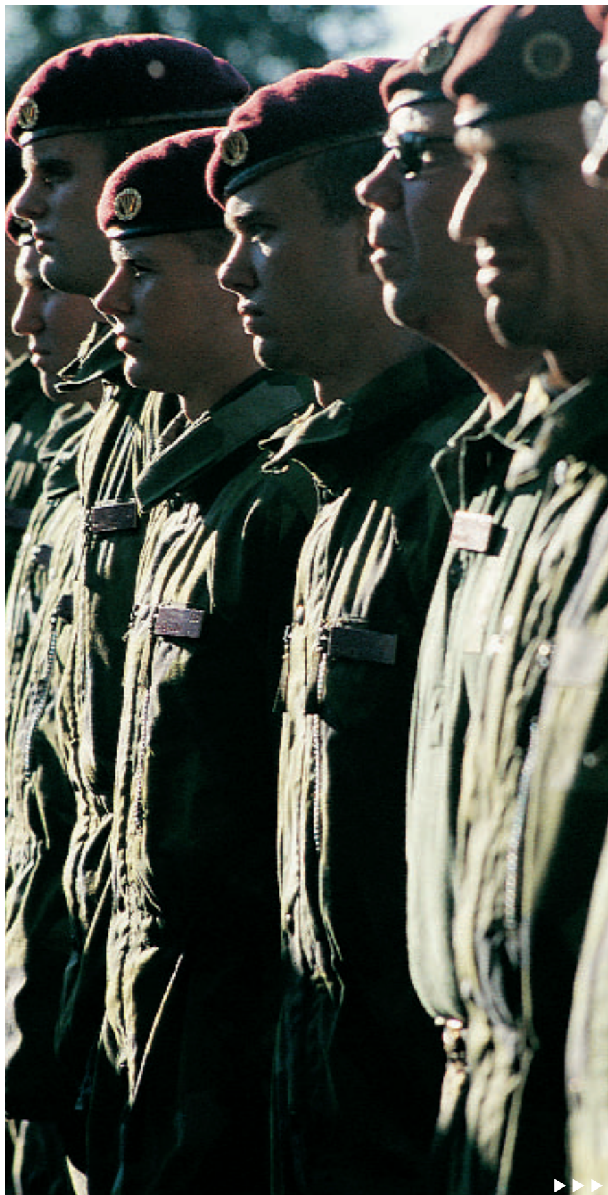
Höger: Jägare med lång tradition.