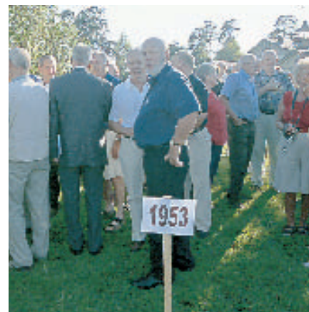
Uppställning skedde efter årskull.

som var tänkta för uppdraget befann sig redan i USA men då beslutet dröjde åkte en av dem hem.