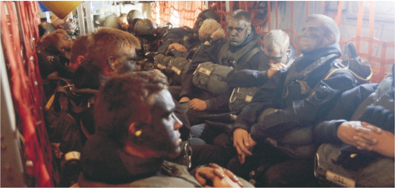
Ju närmare fällning desto mer sammanbitna blir soldaterna. Snart börjar slutövningen på riktigt.

ändra på. De skolan har att locka med är en utbildning med många utmaningar plus en sammanhållning som är svår att mäta sig med.