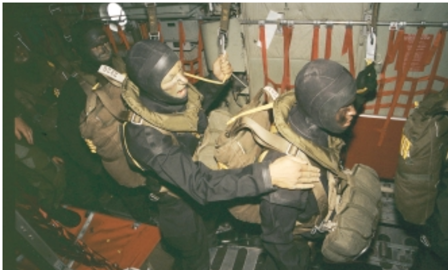
Det är dags. Bullret från Herculesmaskinen och dånet av vinddraget från den öppnade akterrampen gör samtal omöjligt. Klartecken ges med en klapp på axeln.

ningsplatserna är ingen utväg. Fallskärmsjägarens uppgifter har blivit fler och mer komplexa. Fortfarande ska soldaterna klara långa perioder i ödemark, utrustningen har visserligen blivit lättare men i gengäld ska soldaterna bära med sig mer utrustning så totalvikten är densamma. Grundutbildningen är sedan 1993 15 månader, inte heller det är aktuellt att