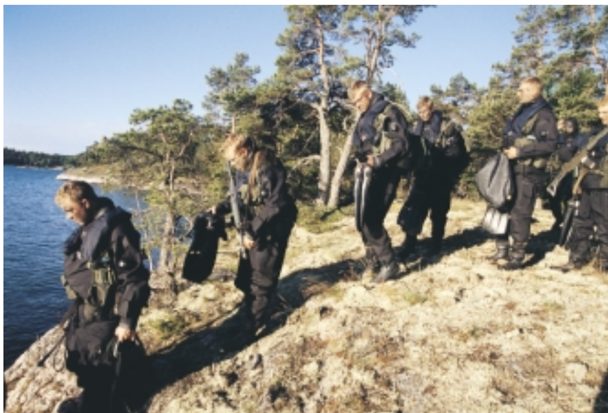
Fallskärmsjägare i annorlunda miljö. Dagens uppgift är att patrullera en av öarna i Stockholms skärgård.

D et är en sliten skara unga män som vaknar upp efter ytterligare en natt under bar himmel. Övningen Baltic Embargo har pågått sedan i tisdags, nu är det fredag morgon. Klockan är fem.