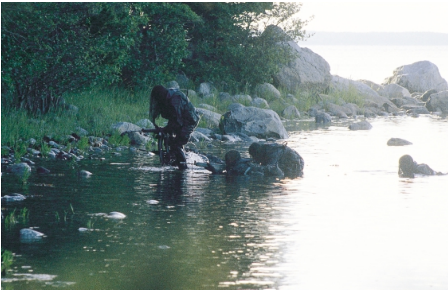
Försiktigt och under tystnad tar sig en grupp fallskärmsjägare i land. Ön ska avpatrulleras, kontakt med fienden kan uppstå.

holms norra skärgård då ett "fel" uppstår i den stridsbåt 90 de befinner sig i. Soldaterna kommer uppmanas att skyndsamt lämna båten som i hög fart stävat mot land. De hamnar på Rindö och blir genast tillfångatagna. Värnpliktiga från tolkskolan i Uppsala ingår i B-styrkan och påbörjar ett förhör som kommer att pågå under 24 timmar. Det är en övning som pressar marginalerna för det tillåtna till max. Med huva över huvudet och en ljudslinga som oavbrutet upprepas tvingas soldaterna stående invänta olika förhör.